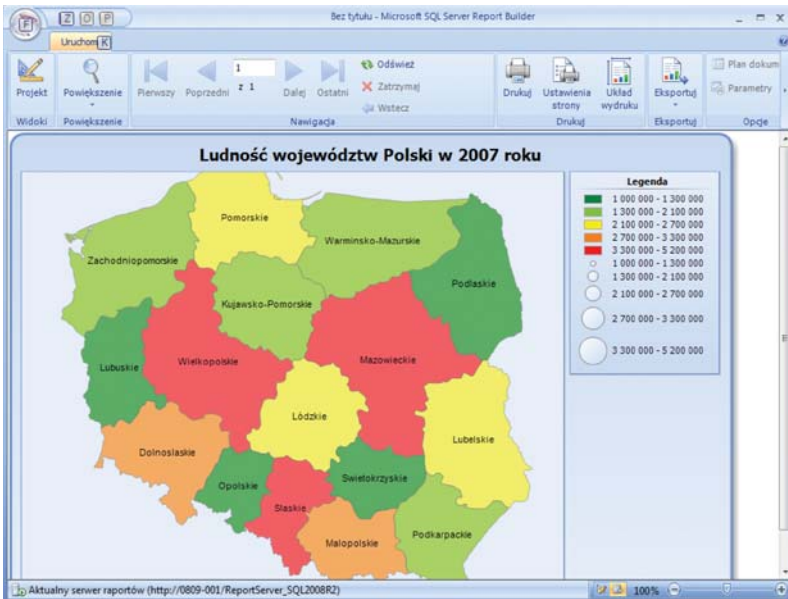
Rys. 3. Przykładowy raport Reporting Services z wykorzystaniem danych przestrzennych